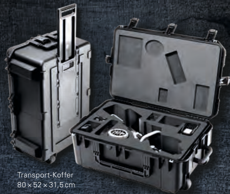
Transport-Koffer 80 × 52 × 31,5 cm